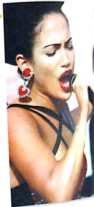
Jennifer López en el papel de Selena

A nosotros 1. gusta mucho el cine. A mí 2. encantan las películas biográficas, como Selena , pero a mi novio 3. aburren. Esta película 4. parece demasiado triste a él. A mis padres 5. interesan los dramas o las comedias. A mi mamá 6. fascina Lo que el viento se llevó ( Gone with the Wind ) con Clark Gable y Vivien Leigh, porque es muy romántica y a ella 7. encantan los vestidos que llevaban las actrices. ¡A mí no 8. interesa nada esa clase de película! ¿Qué clase de película 9. interesa a ti?